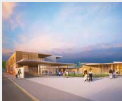
Groupe scolaire des Joncs-Marins.

Grâce à l'Agglomération du Val d'Orge, la médiathèque sera agrandie afin de permettre d'accueillir davantage de documentation et offrir un espace plus important pour accueillir les nouveaux habitants.