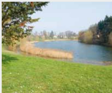
Parc de la Greffière.