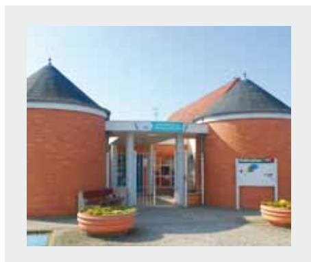
Maison de la petite enfance.

La municipalité poursuivra le développement de ses actions, tout particulièrement en direction de l'enfance, du sport à tous les âges, des retraité(e)s et de l'accessibilité à la culture pour tous et toutes. L'emploi, cette année, restera une priorité absolue.