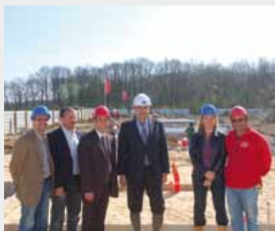
Travaux des Joncs-Marins.