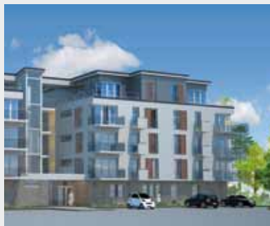
Esquisse des 110 logements.