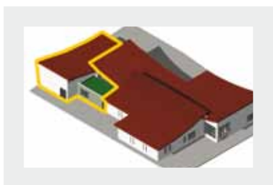
Extension de la médiathèque: 500000 euros.