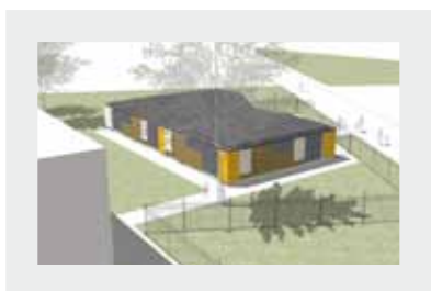
Futur bâtiment à Curie pour les accueils avant et après l'école: 500000 euros.

Maire de Fleury-Mérogis Vice-président de l'Agglomération du Val d'Orge Député suppléant