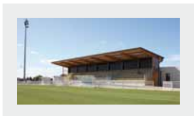
Future tribune du terrain de football: 350000 euros.