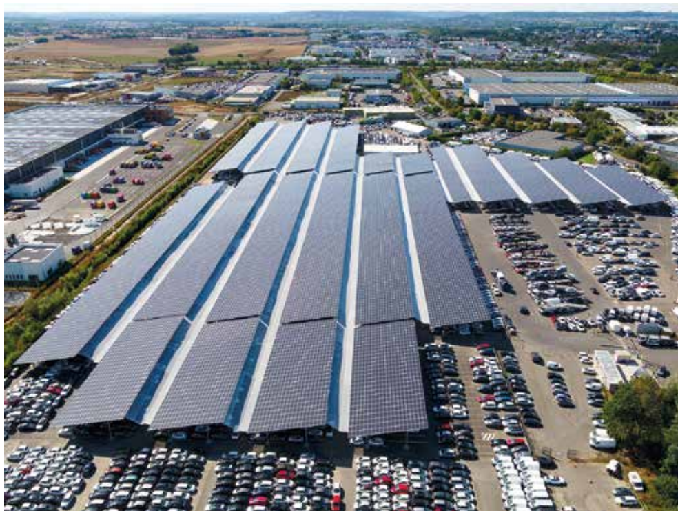
Installés sur les ombrières, les panneaux photovoltaïques produisent l'équivalent de la moitié de la consommation annuelle des Floriacumois.