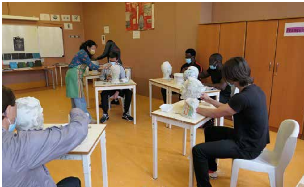
Tout au long de l'année, le pôle culture propose des ateliers aux détenus (ici un atelier sculpture).

M andatée par le Service pénitentiaire d'insertion et de probation de l'Essonne (Spip), l'association Léo-Lagrange assure la programmation des actions culturelles dans les prisons d'Île-de-France. A Fleury-Mérogis, l'association emploie trois salariées qui mettent en œuvre cette politique culturelle. « Tout d'abord, il y a la proposition artistique. Nous travaillons avec de nombreux artistes et compagnies qui interviennent sur des registres très différents allant du théâtre