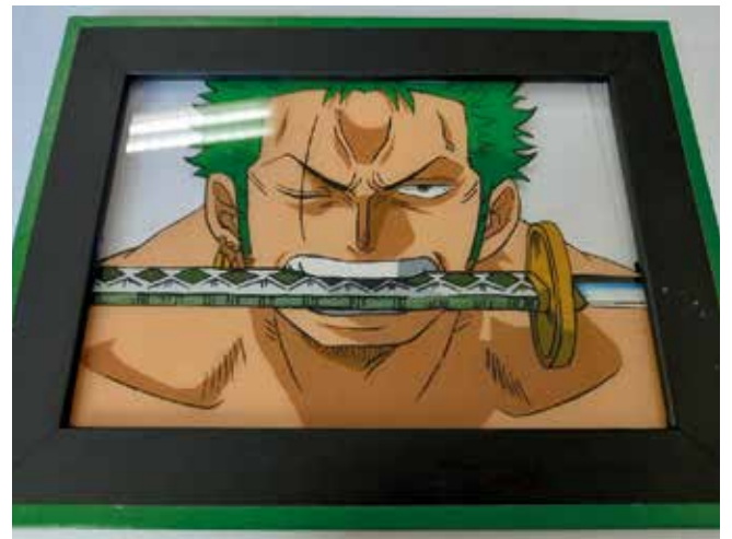
Un exemple de peinture sur vitre réalisée par Méline.

mais aussi imaginer une histoire originale, Méline envisage de réaliser son propre manga. Affaire à suivre... ■