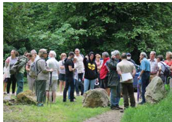
Dessiner ensemble une ville où il fait bon vivre.