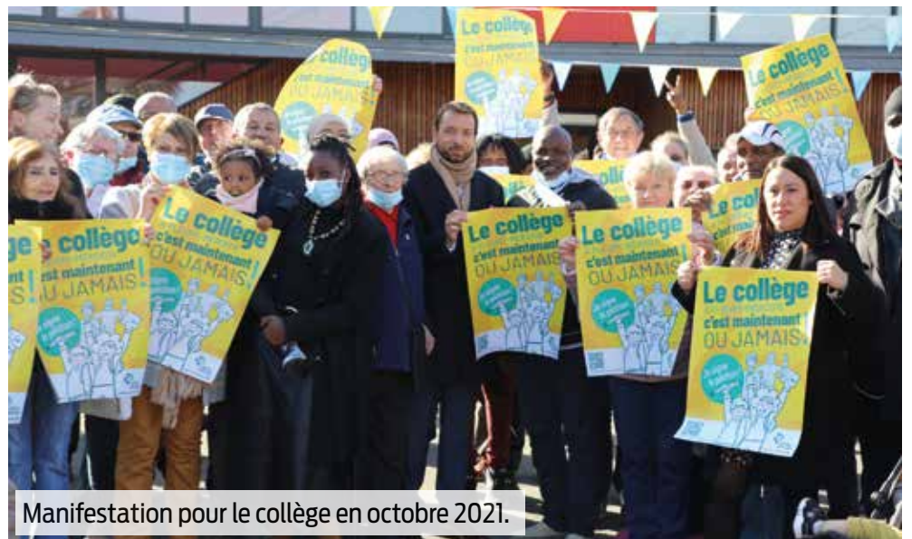
Manifestation pour le collège en octobre 2021.