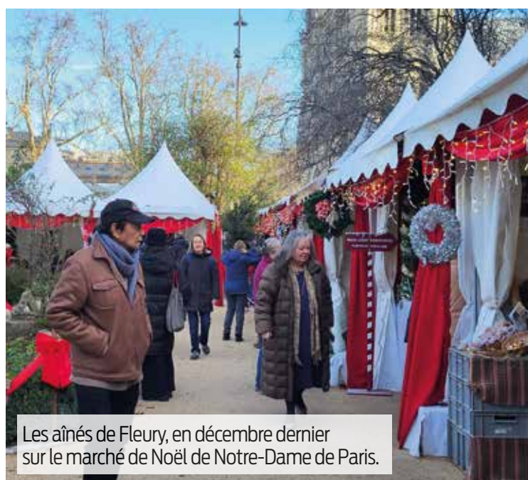
Les aînés de Fleury, en décembre dernier sur le marché de Noël de Notre-Dame de Paris.

Paris, Méréville, Yonne... Retrouvez le programme des escapades programmées pour les aînés floriacumois en 2025.