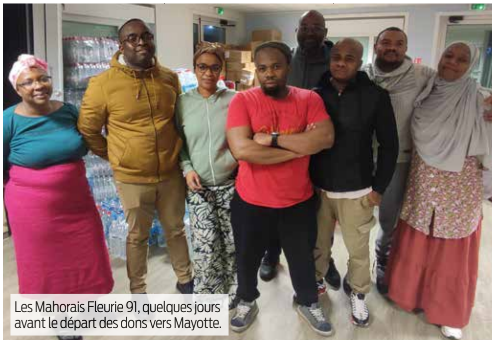
Les Mahorais Fleurie 91, quelques jours avant le départ des dons vers Mayotte.

Une solidarité qui n'a fait que s'accroître. Dès lors, la ville a organisé, en partenariat avec l'association, une campagne de dons pour venir en aide aux Mahorais. Pendant plus de deux semaines, les Floriacumois, parfois même des habitants des communes voisines, ont participé à cet élan de solidarité en apportant des dons alimentaires non périssables, des bouteilles d'eau, des produits d'hygiène et autres matériels scolaires. Mi-janvier, ces dons ont pris la direction des communes concernées. Un container spécial financé par la ville de