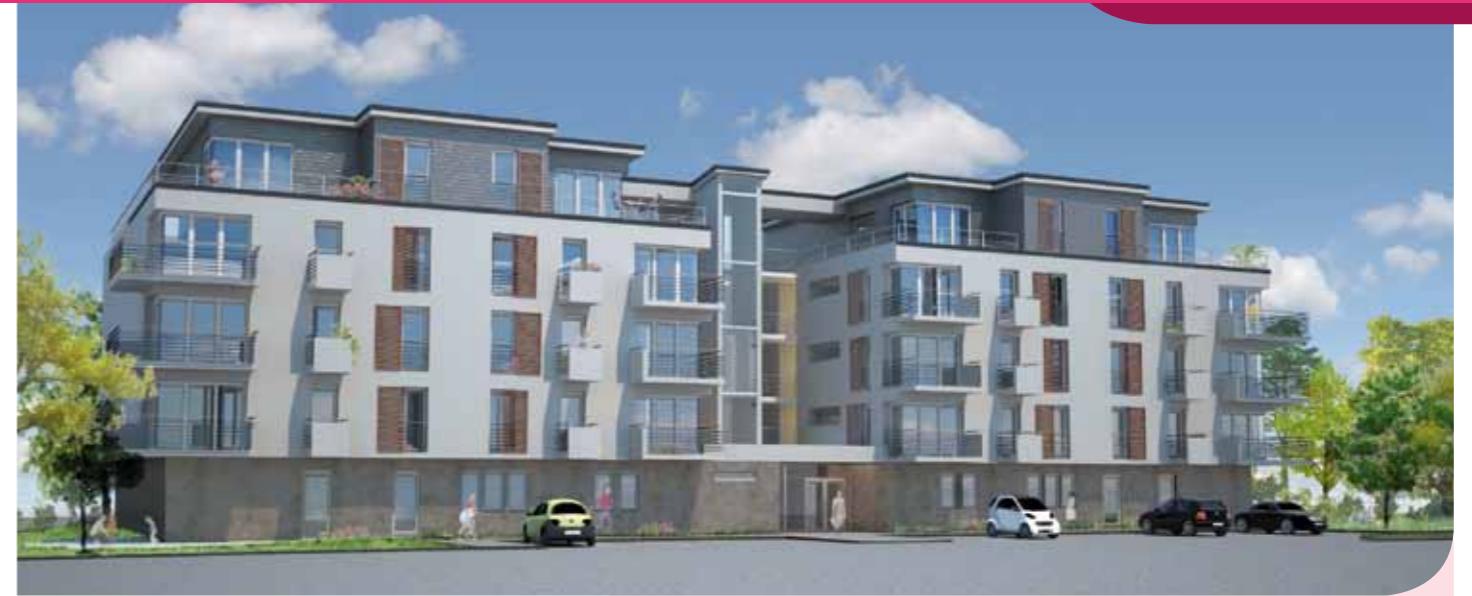
Projet des 110 logements rue de l'Ecoute-s'il-pleut. (Esquisse non contractuelle.)