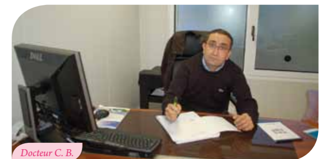
Docteur C. B.