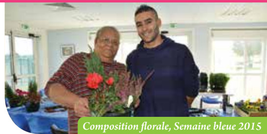
Composition florale, Semaine bleue 2015

→ Pour toute activité, l'inscription est obligatoire au 01 69 46 72 00 ou sur place à l'accueil mairie.