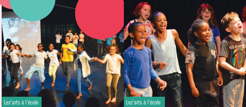
Lez'arts à l'école