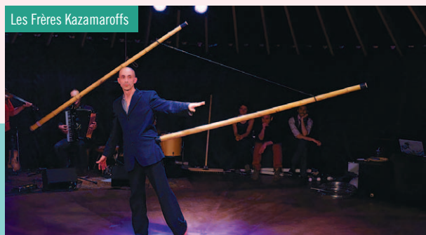
Les Frères Kazamaroffs