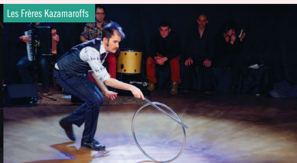
Les Frères Kazamaroffs